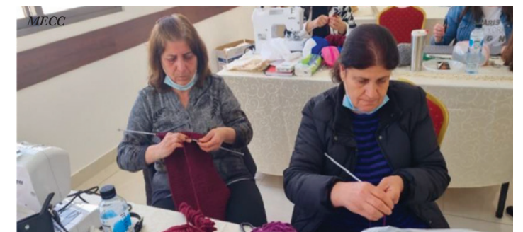
Las mujeres refugiadas aprenden a tejer, tejer y coser como parte de un curso de capacitación para el empoderamiento en Jordania.

“Cuando va por ahí, todo el mundo es positivo, todo el mundo es optimista”, dijo. “No quieren que este curso de capacitación termine. Las vemos hacerse amigas”, e incluso organizar una celebración preboda para una de las chicas.