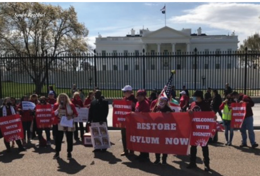
Grupos religiosos y activistas se reúnen en la Casa Blanca para exigir que el gobierno de Biden restaure el derecho de asilo.

PDA no se trata solo de socorro en casos de desastre o de financiación. A medida que nos aventuramos a servir a los solicitantes de asilo, PDA no solo proporcionó fondos, sino que también compartió información y nos conectó con organizaciones ya bien arraigadas en estos ministerios. Sus continuas oraciones, paciencia y aliento han sido un regalo en cada paso de nuestro camino.