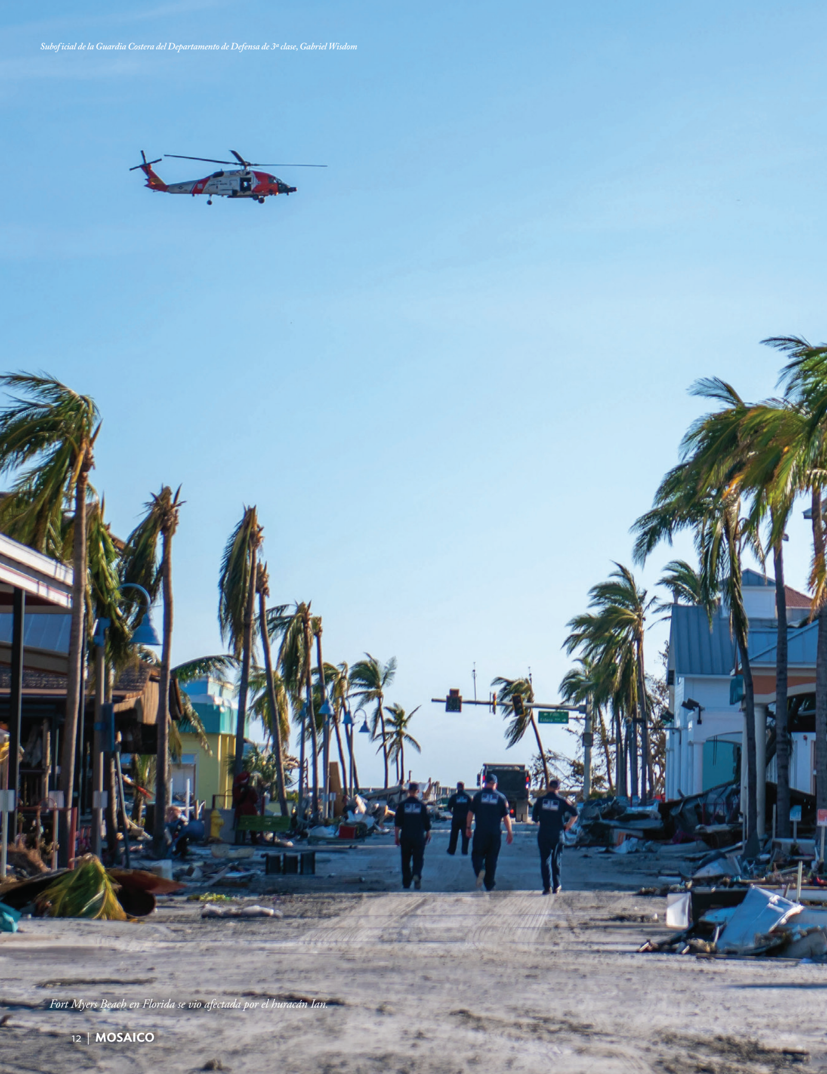
Fort Myers Beach en Florida se vio afectada por el huracán Ian.