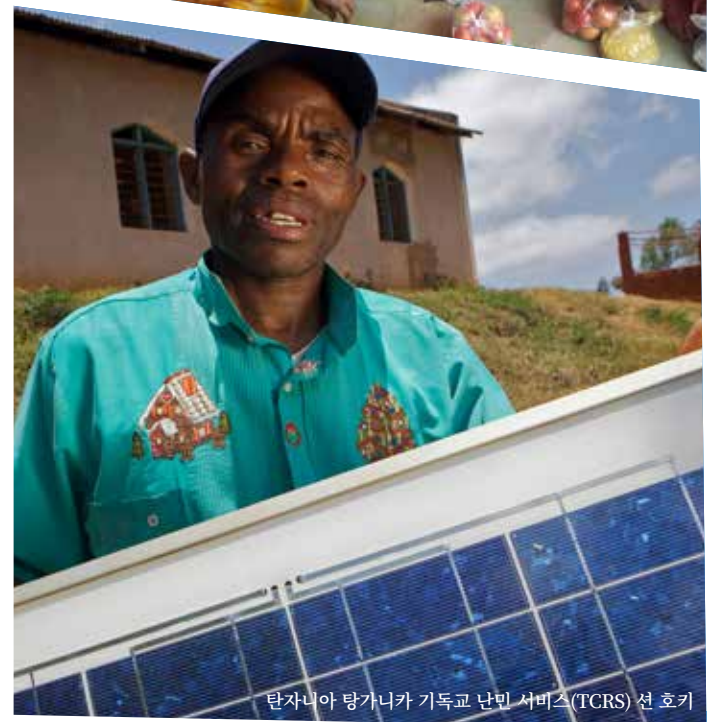
탄자니아 탕가니카 기독교 난민 서비스(TCRS) 셀 호키