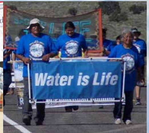
MULTICULTURAL ALLIANCE FOR A SAFE ENVIRONMENT

위대한 나눔의 실천 특별헌금은 가장 크게 기여하는 방법입니다. 장로교인들은 매해 함께 사역합니다, 정의, 회복, 지속가능성을 위하여.